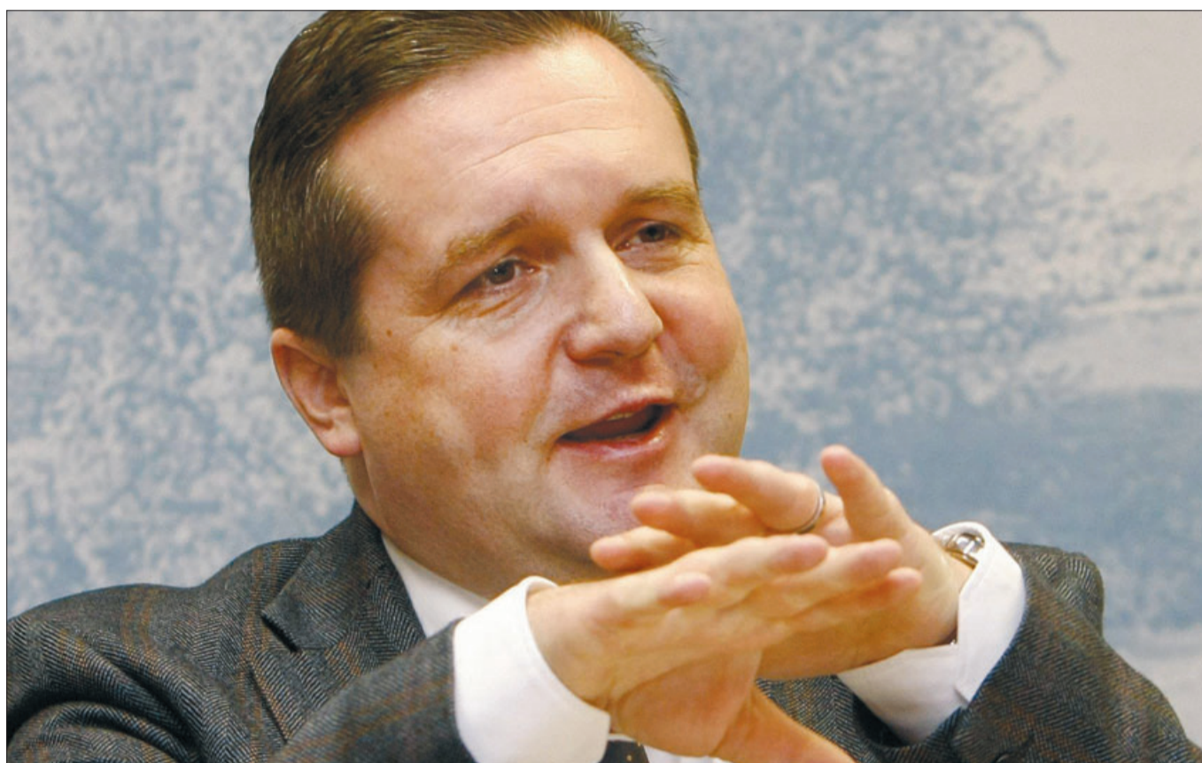
Konzerne und Familienunternehmen stehen gemeinsam für die wirtschaftliche Stärke des Landes, sagt Ministerpräsident Stefan Mappus

Produkte und Spitzentechnologie „Made in Baden-Württemberg“ sind gefragt in aller Welt. Die Menschen und die Unternehmen in unserem Land haben allen Grund, mit Selbstvertrauen in die Zukunft zu blicken. Auch die Auswirkungen der schwersten globalen Wirtschafts- und Finanzkrise seit Jahrzehnten hat Baden-Württemberg schneller als erwartet überwunden. Die aktuellen Zahlen zeigen, dass sich unser Land wieder im Aufschwung befindet und unter den Bundesländern an der Spitze der Entwicklung steht. Seine Wirtschaftsstärke verdankt Baden-Württemberg