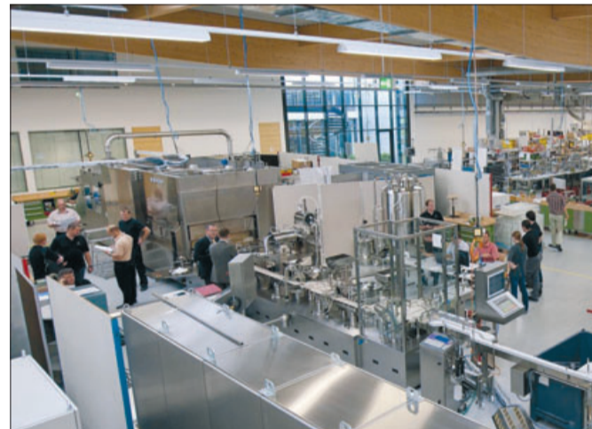
Wie ein Verpackungsmaschinenunternehmen Weltspitze sein kann, wird bei der Optima Group zu sehen sein.

Werksbesichtigung bei der Optima Packaging Group. Der Haller Verpackungsmaschinenbauer stellt sich vor – innovative Verpackungsmaschinen erfordern eine hohe Spezialisierung. Diese erfüllt die Optima Group mit neuen Konzepten zur Entwicklung und Herstellung von branchenorientierten Anlagen in den drei Bereichen Pharma, Consumer (Lebensmittel, Chemie, Kosmetik) und Nonwovens (Papierhygiene).