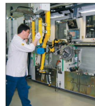
Montage in Neuenstein bei Getrag.