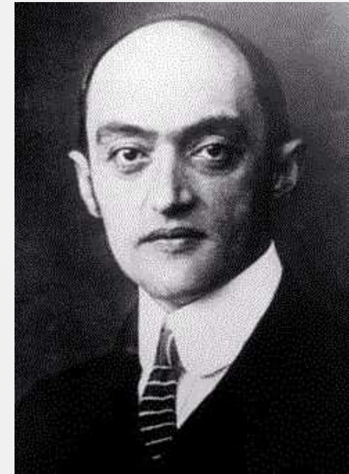
Joseph Schumpeter (1883-1950)